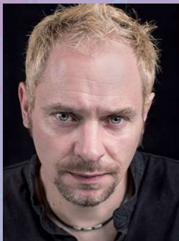
Didier Cohen @Flammarion

Le PRIX ALEF 2014 des Librairies "Mieux-Être et Spiritualité", mention ésotérisme est attribué à